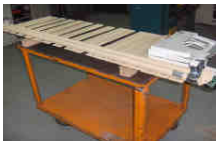
Decrocher l'appareil du mur