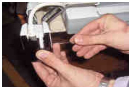
Retirer le boitier