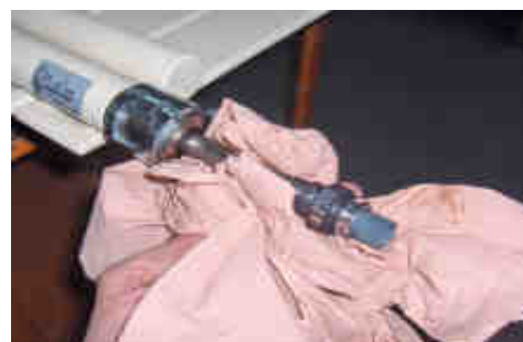
une fois la résistance desserrée, la sortir et l'essuyer avec un chiffon pour éviter les écoulement de liquide

Remontage de la résistance utiliser le Kit adapté et faire l'opération inverse