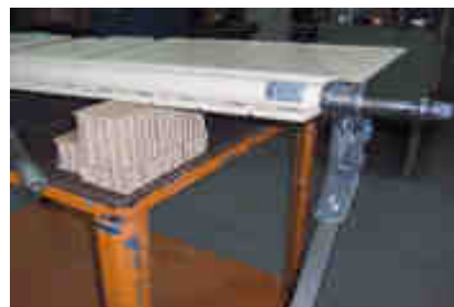
Sur élever l'appareil côté résistance d'environ 20 cm pour éviter que le liquide ne coule