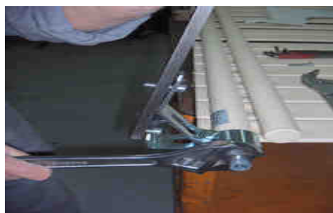
Desserrage de la résistance, maintenir la bride et desserrer la résistance avec la clef