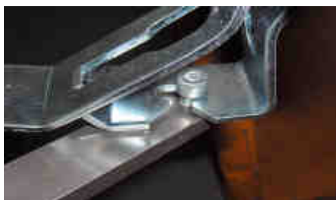
Enclancher la bride dans la fixation (première vis)