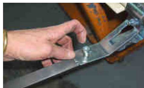
Redresser la bride et la verrouiller avec la deuxième vis sur la fixation