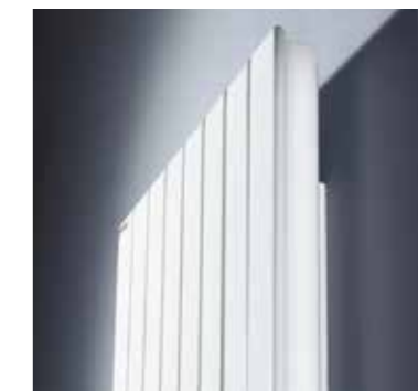
DÉTAIL DES FINITIONS LATÉRALES