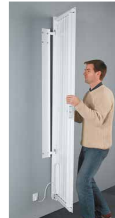
GAIN DE TEMPS ET FACILITÉ DE POSE