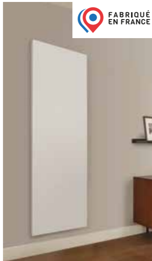
ARTÉMIA + Une façade lisse pour une ligne sobre + Facilité de pose avec sa fixation sur charnière