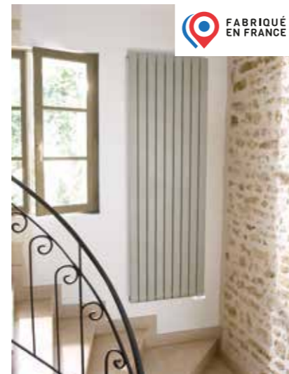
FASSANE VERTICAL + Rayonnement panoramique exceptionnel + Régulation par boîtier Timerprog (Bluetooth*)