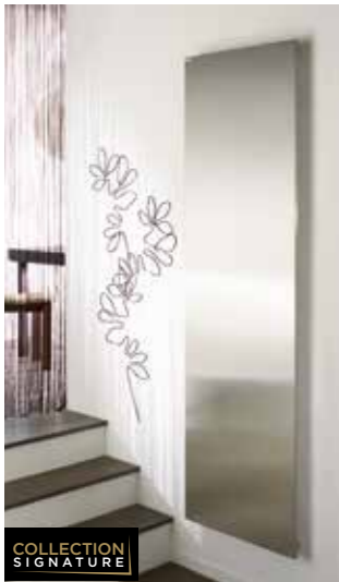
ALTIMA + Design d'exception, avec façade lisse et finitions spéciales