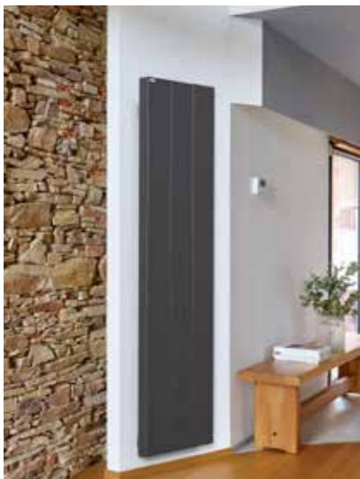
KOLONE + Très léger et chauffage réactif + «Gain de place» : étroit et puissant + Radiateur sans régulation (récepteur inclus)