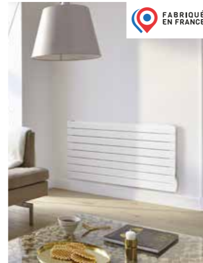
FASSANE PREMIUM (TVXD) + Rayonnement et inertie grand confort + Existe aussi avec tubes horizontaux, et en très basse hauteur (plinthe)