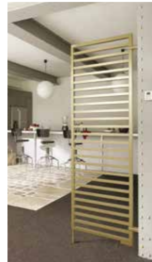
KADRANE + Design carré et ajouré, particulièrement adapté aux intérieurs contemporains