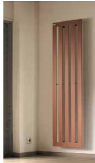
KARENA + Ligne épurée avec un profil biseauté pour une finition parfaite