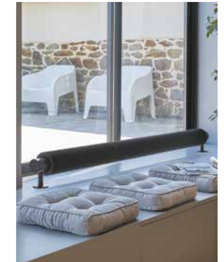
DECOFORM + Design industriel + Radiateur idéal devant les baies vitrées