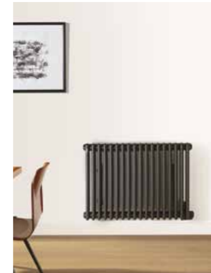
VUELTA + Design rétro pour les intérieurs classiques ou contemporains