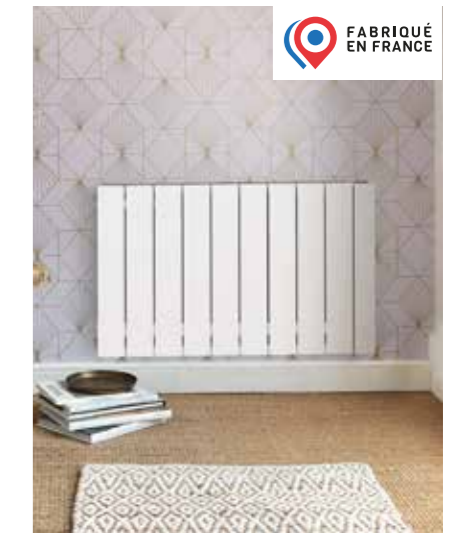
ATOLL + Éléments droits + Régulation en position haute