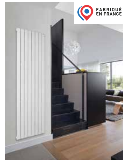
FASSANE PREMIUM + Rayonnement panoramique exceptionnel + Pose sur charnière + Régulation par télécommande