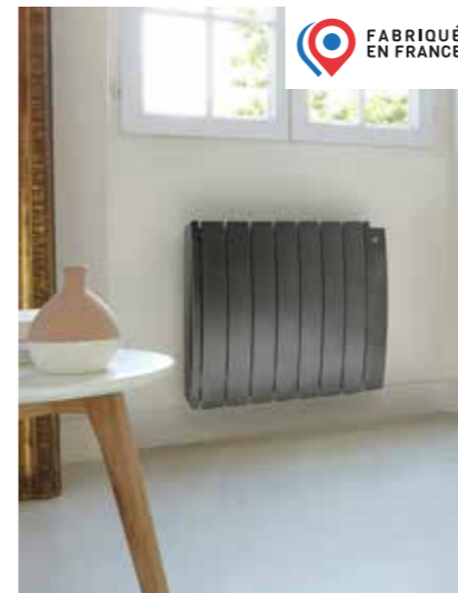
TAÏGA PREMIUM + Design galbé + Régulation en position haute + Avec fonction détection de présence + Écran tactile